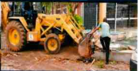
Administración Regional de Arequipa - UDF