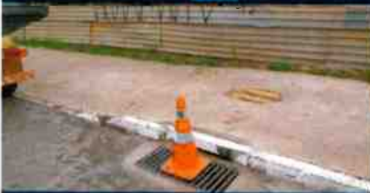
Administración Regional de Arequipa - UDF