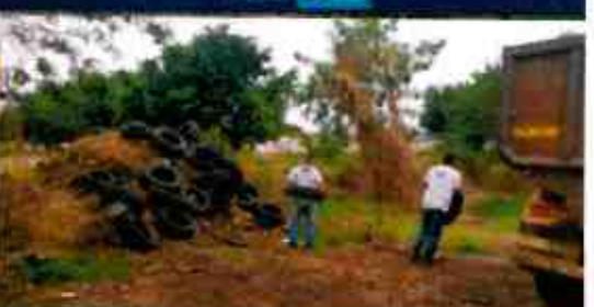
Administración Regional de Arequipa - UDF