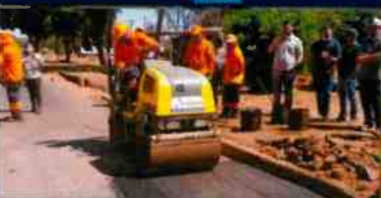
Administración Regional de Arequipa - UDF