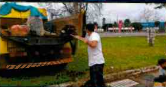
Administración Regional de Arequipa - UDF