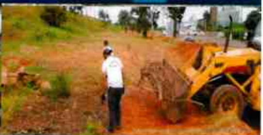
Administración Regional de Arequipa - UDF