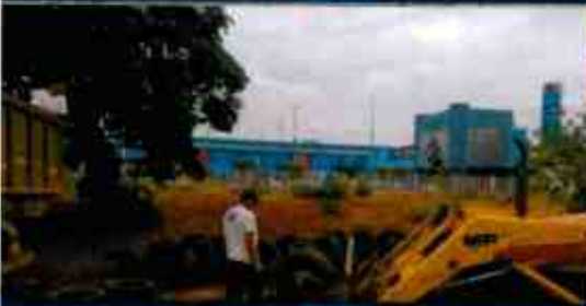
Administración Regional de Arequipa - UDF