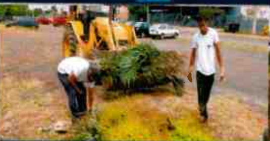
Administración Regional de Arequipa - UDF