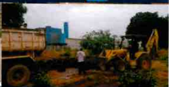
Administración Regional de Arequipa - UDF