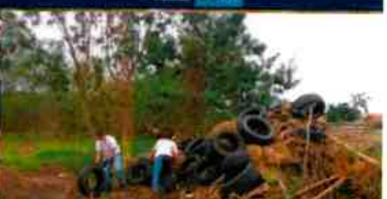
Administración Regional de Arequipa - UDF