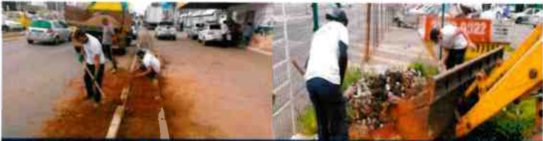
Administración Regional de Arequipa - UDF